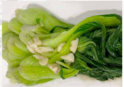
上海青 102. CHF 22.00 gebratener Pak Choi mit Knoblauch fried pak choi with garlic