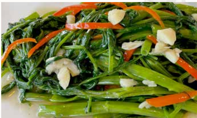
空心菜 103. CHF 22.00 frittierte Winde (Blume) mit Knoblauch und Wasserspinaat fried Morning Glory with garlic and water spinach