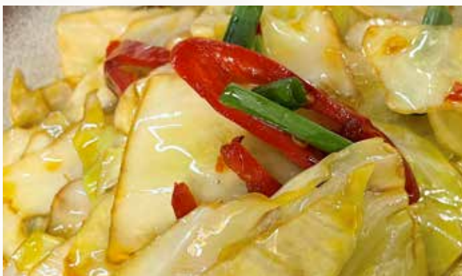
手包菜 105. CHF 22.00 🌶️ Gebratener gezupfter Weisskohl griddle shredded cabbage