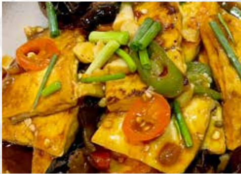
家常豆腐 101. CHF 24.00 🌶️ Sautierter Tofu nach Gastgeber Art sautéed Tofu host style