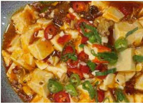
麻婆豆腐 100. CHF 25.00 🌶️ weicher Tofu Würfel mit gehacktem Schweinefleisch (Pikant) soft tofu cubes with minced pork (spicy)

TOFU / GEMÜSE (exkl. Beilage) TOFU / VEGETABLES