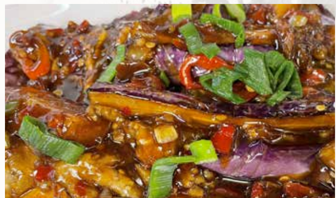
鱼茄子 106. CHF 24.00 🌶️ Auberginen nach Szechuan Art, mit Knoblauch Szechuan style eggplant with garlic