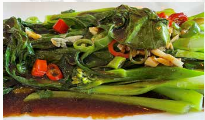
蚝油芥蓝 104. CHF 23.00 Thailändischer Brokkoli an Austernsauce Thai broccoli with Oystersauce